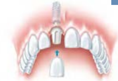
Das Implantat im Knochen | Der Implantat-Kopf | Die Krone vor Befestigung