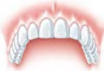
Fertig – Ein schönes Lächeln am selben Tag!