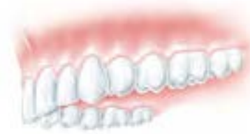
Fertig – Kauen mit Biss!