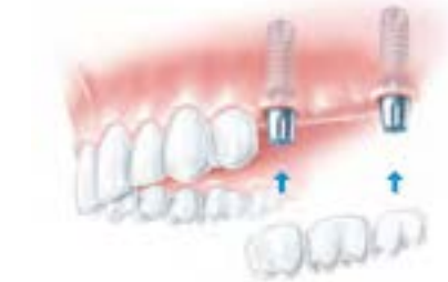
Die Implantate im Knochen | Die Implantat-Köpfe | Die Brücke vor Befestigung