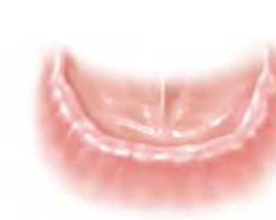
Keine Zähne – kein Halt der Prothese