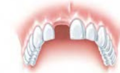
Die Lücke nach dem Zahnverlust