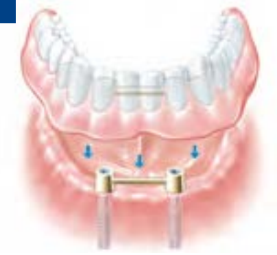
2 Implantate im Kiefer mit einer Stegverbindung