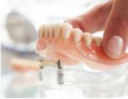
Optimaler Halt für Ihren Zahnersatz!