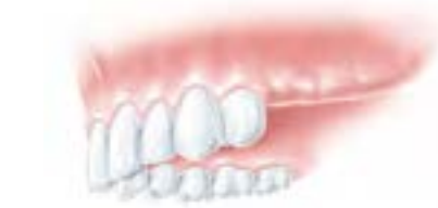
Die fehlenden Zähne